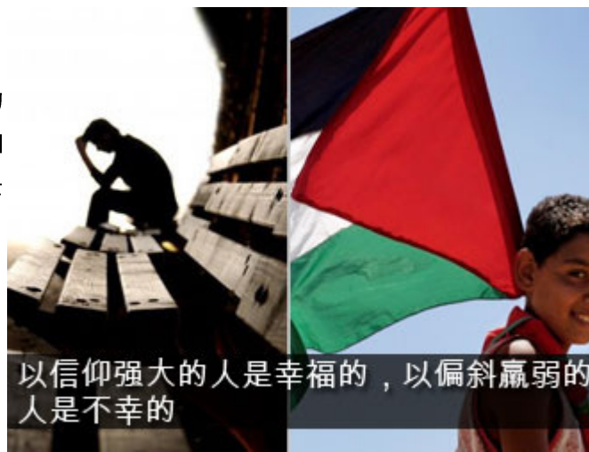
以信仰强大的人是幸福的，以偏斜羸弱的人是不幸的

尊贵的兄弟们，这些是诚实的穆斯林社会应该有的幸福、和睦、喜爱、平安，这些是信士应该具有的，