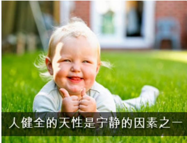
人健全的天性是宁静的因素之一

信士宁静的第一个原因就是：它被引导于被赋予他的天性，和谐的天性，匀称的天性，与存在意识相互应，伴随着伟大的创造者的方针，因此信士与他的天性生活在平安和和睦中，而不是战争和争端中，与他周围的人是透明的、互助的，而不是野蛮的、仇视的。