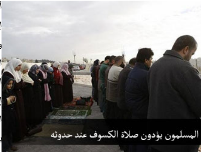
المسلمون يؤدون صلاة الكسوف عند حدوثه

أيها الأخوة المؤمنون، توفي سيدنا إبراهيم بن رسول الله عليه الصلاة والسلام، فوقف النبي موقف الأب الرحيم، المؤمن بقضاء الله وقدره، الصابر لحكمه، الراضي بمشيئته، فقال: إنما أنا بشر، تدمع العين، ويخشع القلب، ولا نقول ما يسخط الرب، والله يا إبراهيم، إنا بك لمحزونون وقد رافق موت سيدنا إبراهيم كسوف