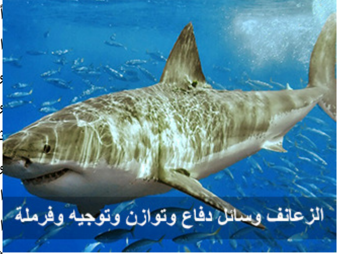
الزعانف وسائل دفاع وتوازن وتوجيه وفرملة

أيها الأخوة، ولكن العلماء وقفوا عند الزعانف، هذه الزعانف، قالوا عنها: إنها وسائل للدفع، والتوازن، والتوجيه، والفرملة، إن صحَّ التعبير، إنها تقف أو تخفف سرعتها عن طريق الزعانف، وإنها تتحرك نحو الأمام عن طريق الزعانف، وأنها تتوازن عن طريق الزعانف، وإنها تعدّل وجهتها، يميناً أو شمالاً، ارتفاعاً أو انخفاضاً، عن طريق