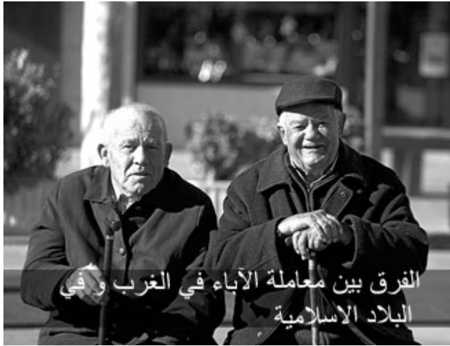
الفرق بين معاملة الآباء في الغرب وفي البلاد الإسلامية

حدثني أخ ذهب إلى ألمانيا ما وجد فندقاً في معرض مشهور، فاضطر أن يسكن في بيت عند امرأة، أقسم لي بالله أنه في كل حياته وعمره يزيد عن ستين سنة ما وقعت عينه على حديقة في بيت أجمل من حديقة هذا البيت الذي سكنه في ألمانيا، السبب أن الأم تجهد طوال العام في تزيين البيت، وإعداد الحلويات، وأطيب الطعام كي