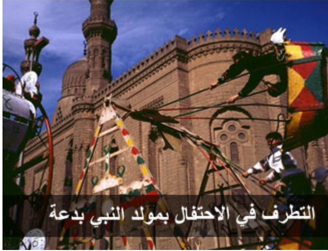
التطرف في الاحتفال بمولد النبي بدعة

الاحتفال بذكرى المولد ليس عبادة ولكنه يندرج تحت الدعوة إلى الله :